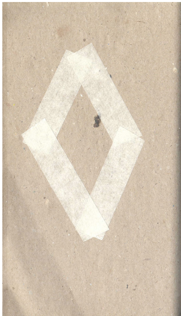
figur 2. Tapefiguren på side 52 overfor vers 20

Nu er jeg stadig ikke færdig med at oversætte tapestrimlerne til lyd, da det er et langsommeligt og processortungt arbejde, men indtil videre har jeg ikke fundet nogen direkte sammenhæng mellem en minuts-lyd og det tilsvarende Bev Bavebke Kvabbe ord. Alligevel er jeg sikker på at sammenhængen er der et sted. Forhåbentlig vil disse brikker falde på plads, når vi engang har alle tapestrimler som lyd, og måske en gang får knækket koden i Bev Bavebke Kvabbe.